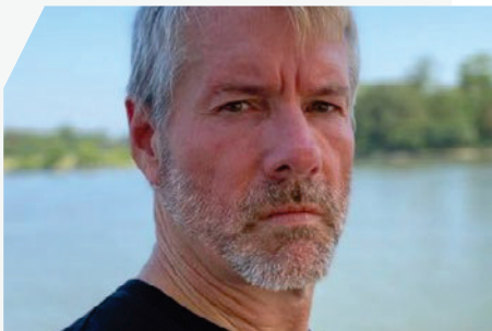
Michael J. Saylor, CEO von MicroStrategy

My formula for success is rise early, work late and buy bitcoin.»